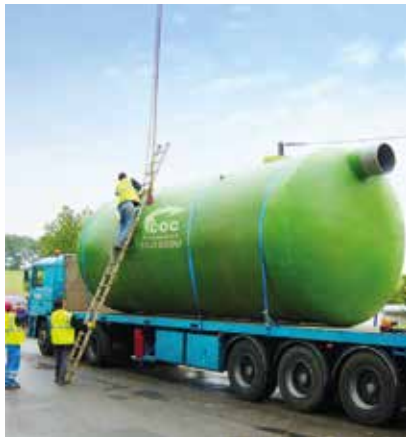
Déchargement du produit.