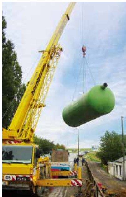
Manutention du produit.